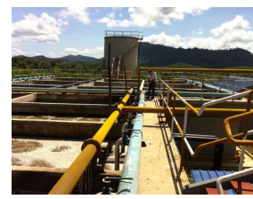
SDパームオイル工場