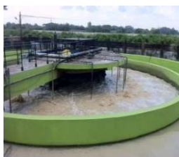
ミャンマービール工場

中国 タイ マレーシア インドネシア ミャンマー インド ベトナム等の 染色工場・食品工場・製紙工場・ 化学工場・パームオイル工場・ ゴム工場等に多くの導入実績があります。