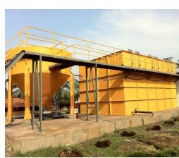
マレーシアPパームオイル工場